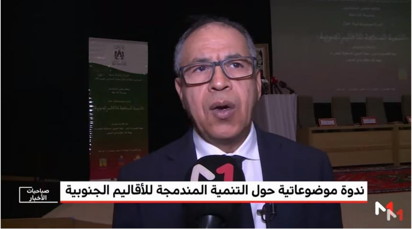
"روبورتاج من الداخلة .. ندوة موضوعاتية حول "التنمية المندمجة للأقاليم الجنوبية"