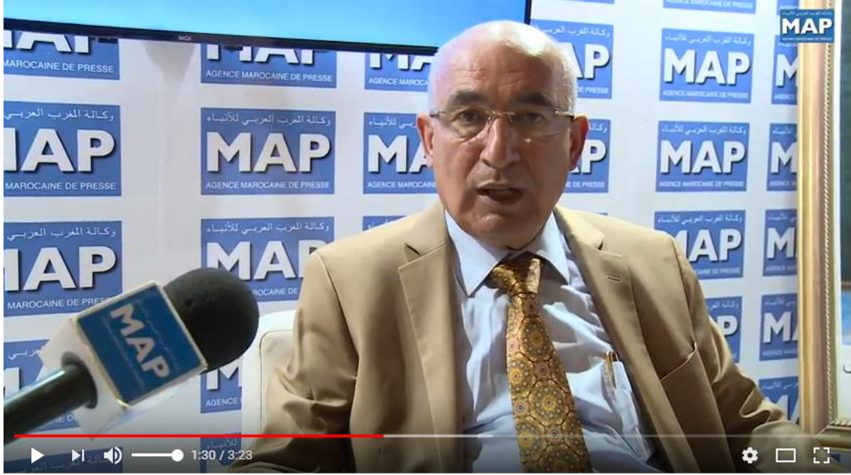
"مجلس المستشارين ينظم يوم 28 يونيو بالداخلة ندوة حول "التنمية المندمجة للأقاليم الجنوبية"