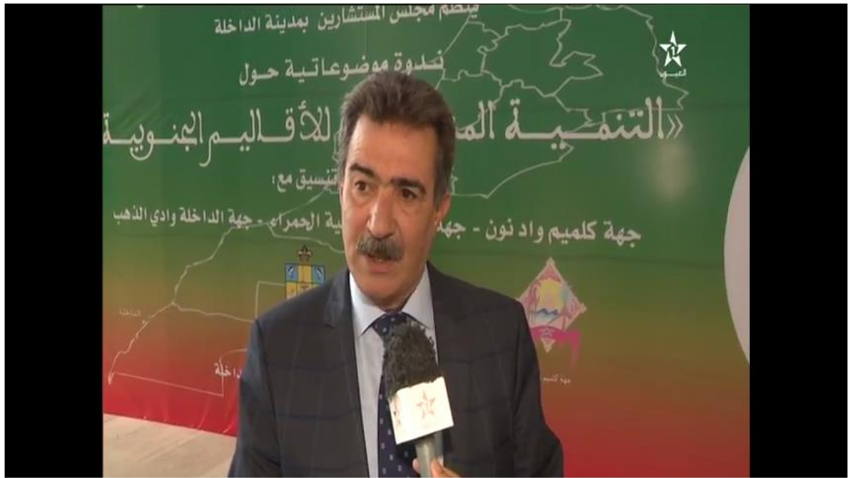
الداخلة: التنمية المتكاملة للأقاليم الجنوبية