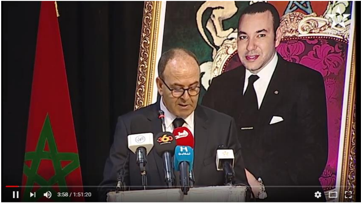
الندوة الموضوعاتي حول : التنمية المتكاملة للأقاليم الجنوبية - الجزء الأول